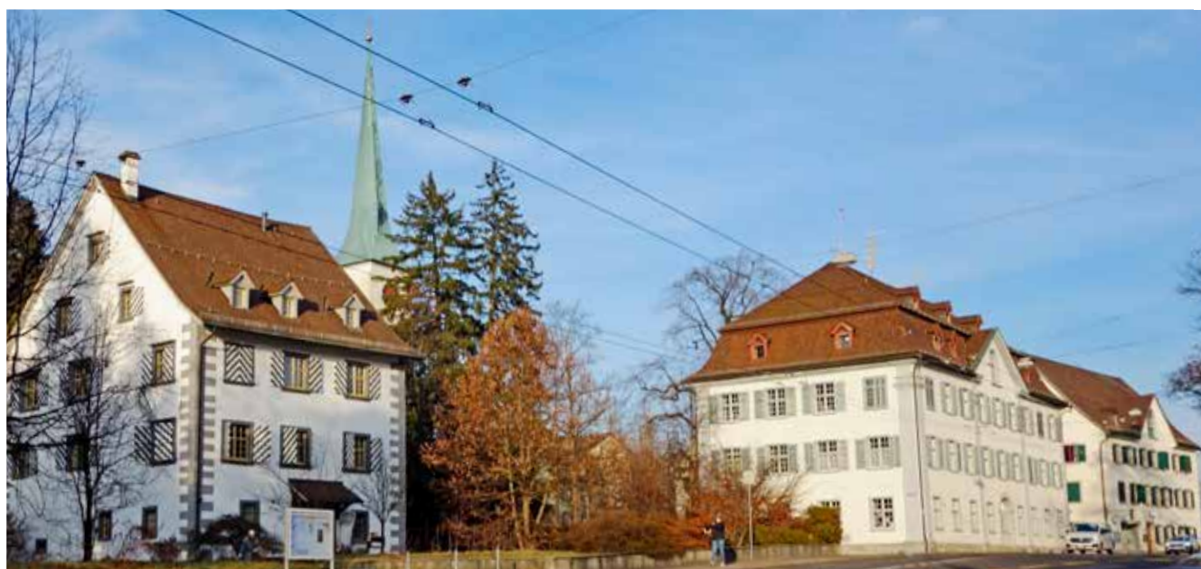
Die Kirche St. Fiden mit dem Pfarrhaus, das Amtshaus Tablat und das Gasthaus Hirschen (v.l.n.r.)

Die Reformation der 1520er-Jahre erfasst die Stadt St. Gallen, nicht aber das katholische Umland. Das führt zu Konflikten, etwa wenn städtische Fuhrleute an katholischen Feiertagen die Tablater Strassen nutzen. 1590 wird die Klosterschule mangels katholischer Schüler aus der Stadt nach St. Fiden verlegt.