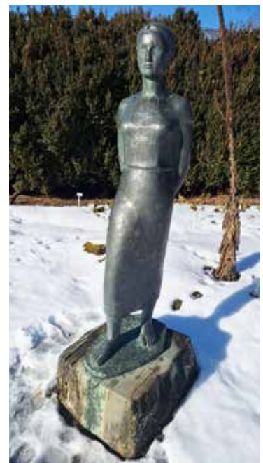
«Junge Frau», undatiert