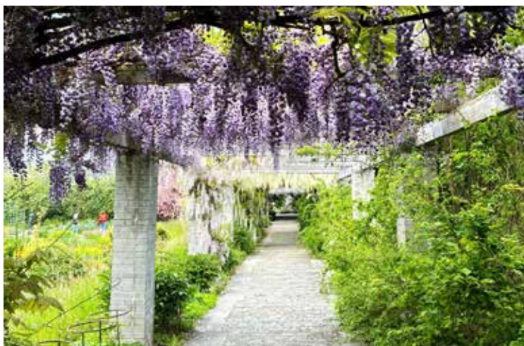
Japanische Blauregen-Pergola im Botanischen Garten

Um Gott Pan ranken sich unzählige Mythen und eine imposante göttliche Ämterkumulation: Pan ist auch Gott der Wälder, der Berge, der Jäger, der ungezähmten Natur, der Wollust, der Ekstase, er ist Begleiter des Weingottes Dionysos und liebte die ländliche Musik. Er musizierte und hoffte auf die Gefolgschaft seiner angebeteten Nymphe Syrinx, die sein Werben jedoch ablehnte und am Fluss Ladon von einer schützenden Gottheit in ein Schilfrohr verzaubert wurde. Aus Kummer schnitt sich Pan aus diesem eine sieben-