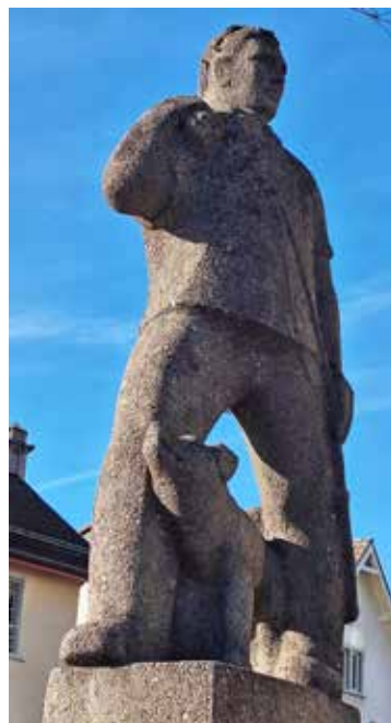
«Fuhrmann mit Bläss», Brunnen, 1937