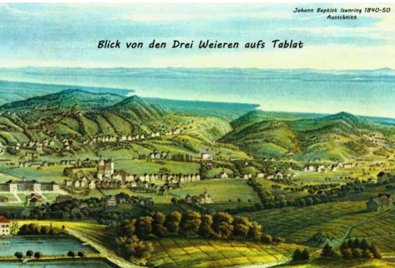
Die Kirche St. Fiden links in der Bildmitte, im Hintergrund der Bodensee

Mit dem wachsenden Verwaltungsaufwand für das katholische Umland lässt Fürstabt Cölestin Guggler von Staudach 1766 neben der Kirche ein stattliches Amts- und Schützenhaus bauen. Unten treffen sich die Schützen, oben residiert der Lehensvogt als Richter und Verwalter der Ländereien des Klosters.