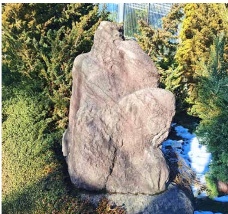
«Pan (Hirtengott)» von Wilhelm Meier, St. Gallen, 1957