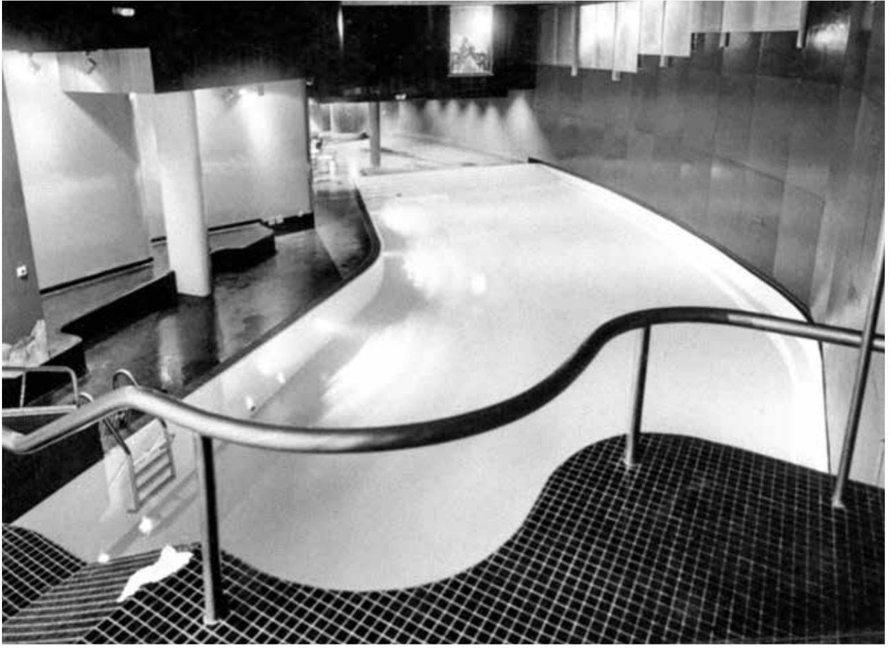
Bilder: ©Katrin Eberhard, Heinrich Graf: 1930–2010: Bauten, Projekte, Interieurs (2011)