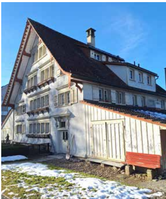
Hof Tablat am Grütlweg 5

Täglich offen von 08.00 bis 17.00 Uhr, Schauhäuser von 08.00 bis 16.45 Uhr Am 25. Dezember und 1. Januar geschlossen.