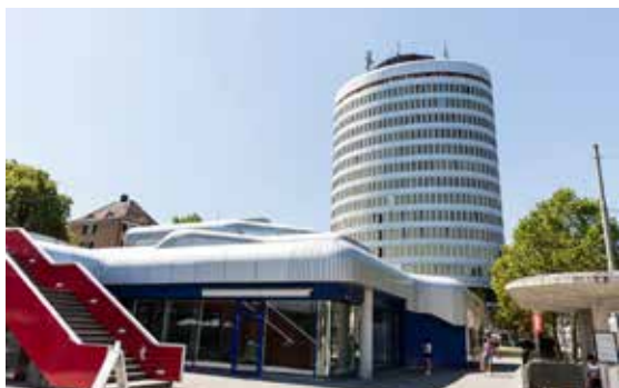
Grossacker